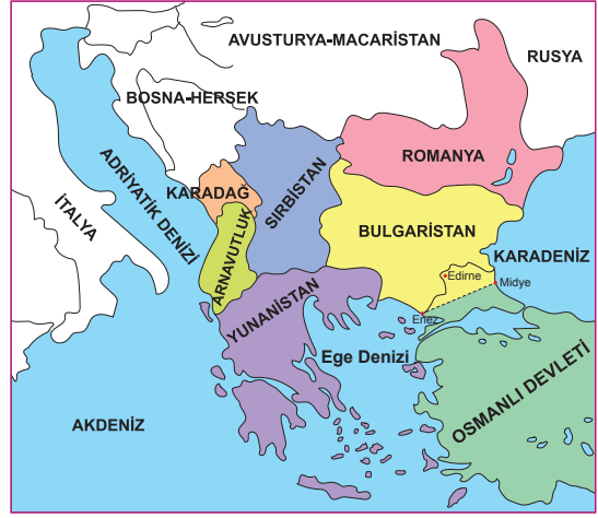
I. Balkan Savaşı Sonrası Balkanlar

Bu haritaya bakılarak I. Balkan Savaşı'nın sonuçları ile ilgili aşağıdakilerden hangisine ulaş ılamaz?