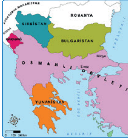
I. Balkan Savaşı öncesinde Balkanlar