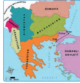
II. Balkan Savaşı sonrasında Balkanlar

Verilen haritalara göre aşağıdakilerden hangisine ulaşamaz?