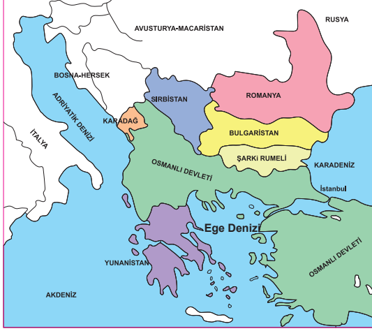
I. Balkan Savaşı Öncesi Balkanlar