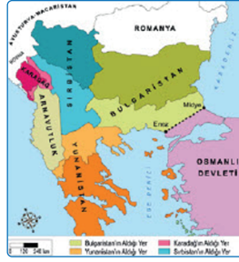
I. Balkan Savaşı sonrasında Balkanlar